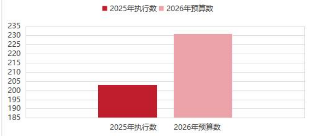
图4：一般公共预算财政拨款变化情况 (单位：万元)